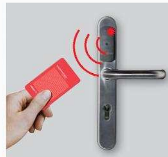
3. Az engedélyezési eljárás befejezése