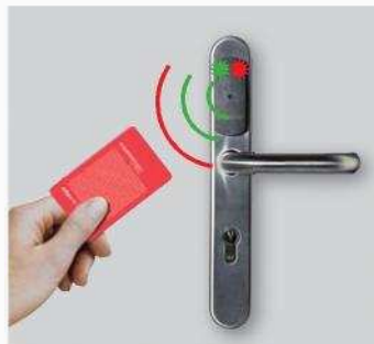
1. Az engedélyezési eljárás elkezdése

Három lépésben történik, a programozó kártya, és a felhasználói kártya felhasználásával