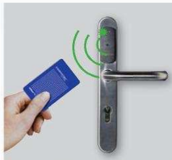
2. A felhasználói kártya/kártyák engedélyezése